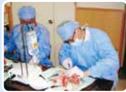
インプラント埋入実習