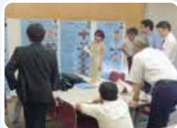
専修医取得試験の準備