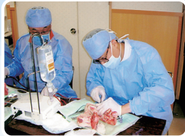
インプラント埋入実習