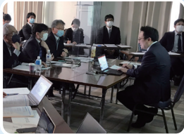
専修医取得試験の準備